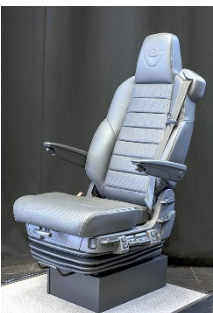
MEDIUM PLUS VÄNSTER/LEFT