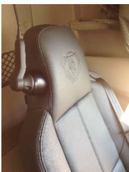
PREMIUM/RECARO VÄNSTER/LEFT MED INTEGRERAD TELEFON/WITH INTEGRATED PHONE