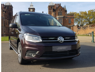
VW CADDY 2015+