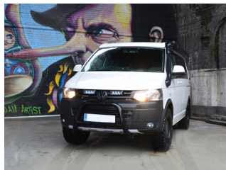
VW TRANSPORTER 5 2010+