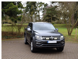
VW AMAROK V6 2016+