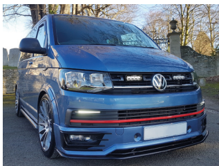
VW TRANSPORTER 6 2016+